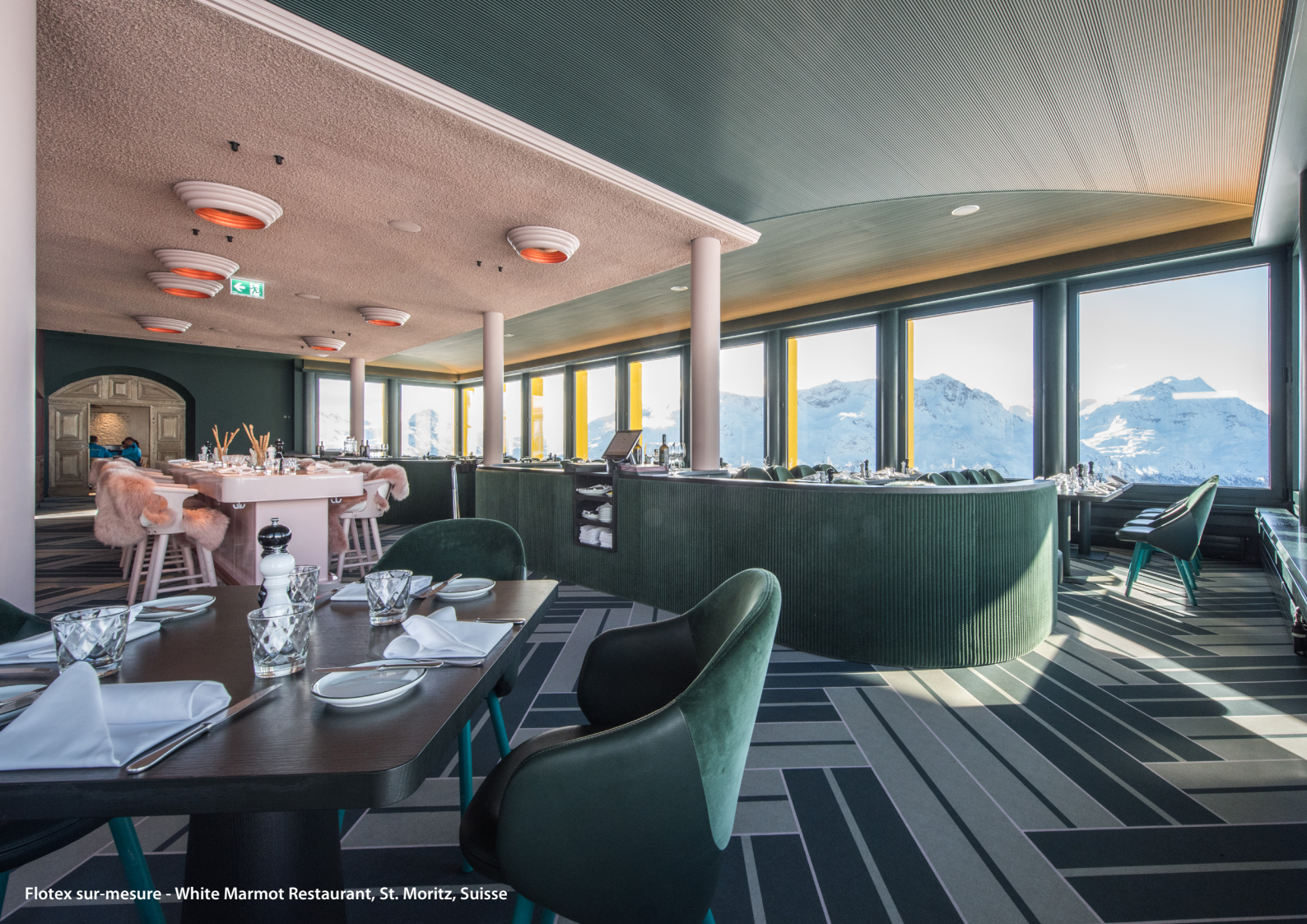
Flotex sur-mesure - White Marmot Restaurant, St. Moritz, Suisse