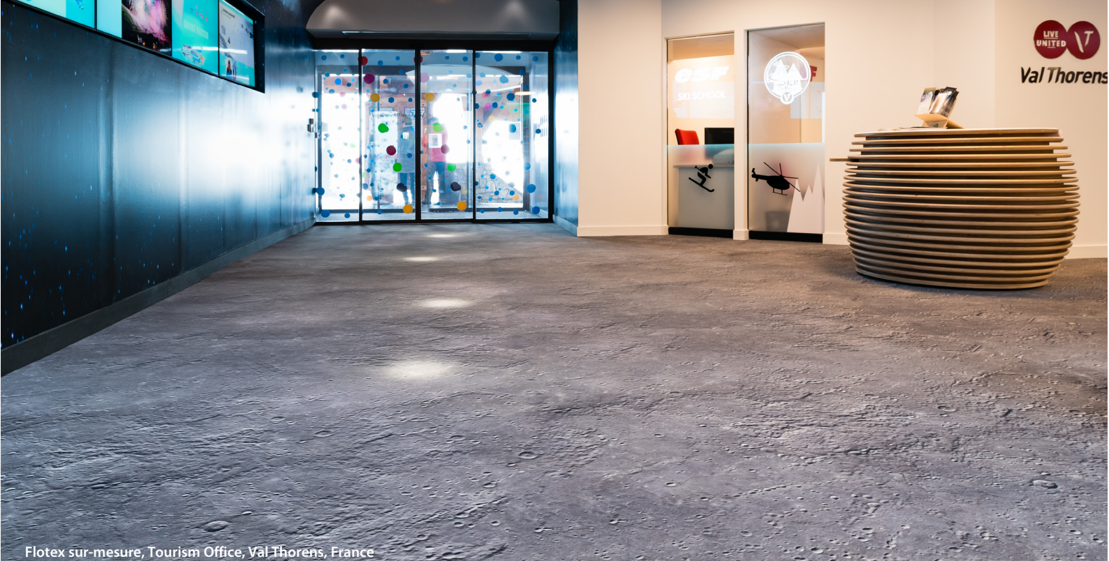
Flotex sur-mesure, Tourism Office, Val Thorens, France