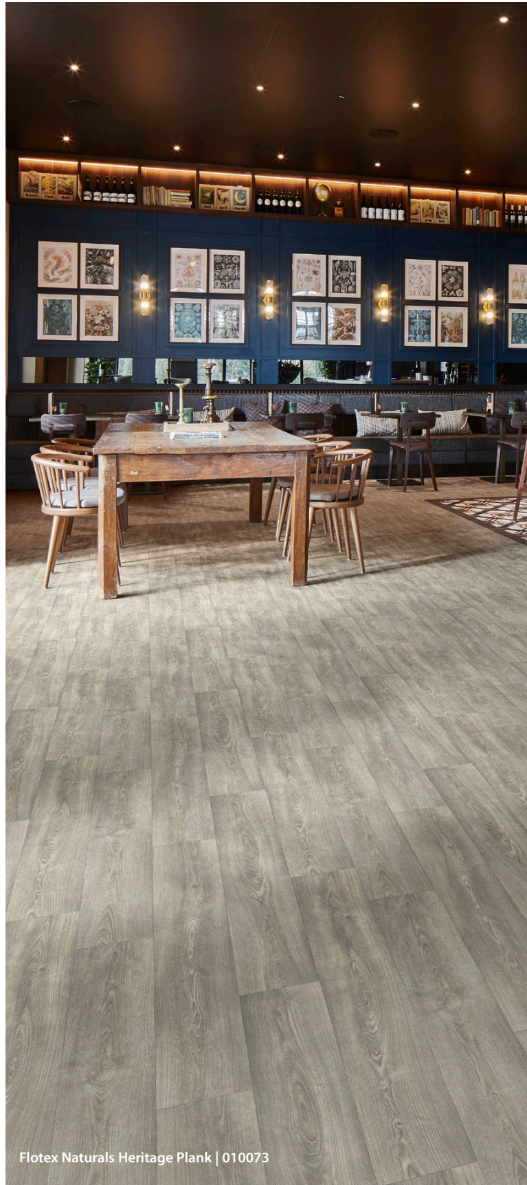
Flotex Naturals Heritage Plank | 010073

Grâce à sa structure unique, Flotex un revêtement de sol plus hygiénique que les autres textiles et c'est le seul revêtement de sol textile qui soit certifié par la British Allergy Foundation . Il contribue à améliorer la qualité de l'air intérieur, avec un très faible taux d'émissions de COV et est certifié Eurofins Comfort Gold .