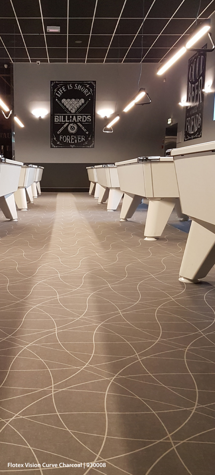
Flotex Vision Curve Charcoal | 930008

Toutes les entités de vente Forbo Flooring Systems sont certifiées ISO 9001 (management de la qualité). Toutes les usines Forbo Flooring Systems sont certifiées ISO 14001 (management de l'environnement). L'Analyse du Cycle de Vie (ACV) de l'ensemble des produits Forbo Flooring Systems est disponible dans les FDES. Celles-ci sont téléchargeables sur nos sites internet.