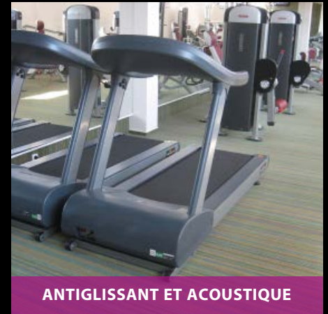
ANTI GLISSANT ET ACOUSTIQUE

Les raisons pour lesquelles la gamme Flotex® est idéale pour les salles de fitness et salles de gym :