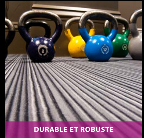
DURABLE ET ROBUSTE